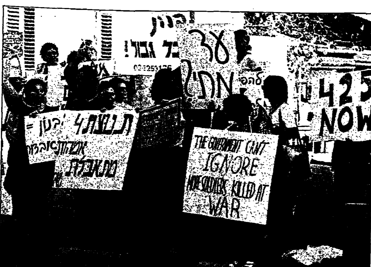
اسرائيليين يتظاهرون بالمطالبة بالانحساب من جنوب لبنان